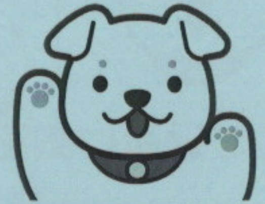
金沢市動物愛護マスコットキャラクター さわまる

海外では狂犬病の感染により、たくさんの人の命が失われています。再び日本に狂犬病が広がらない為に、法律で生後91日以上の犬は登録と毎年の狂犬病予防注射が義務づけられています。